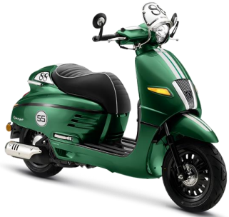
Xanh Lá V6