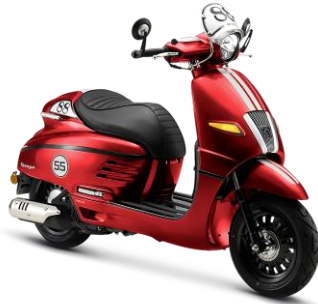
Đỏ Cherry T4