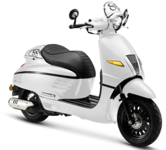
Trắng Sữa P7