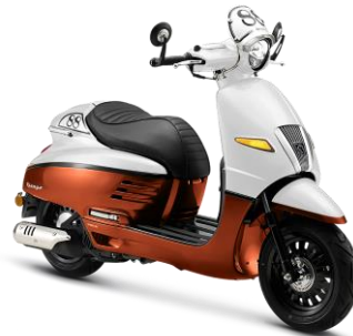
Trắng - Cam P7/U1