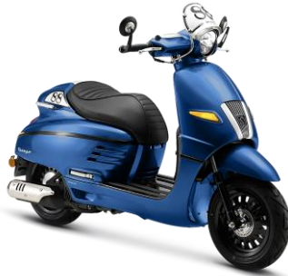
Xanh nước biển S5