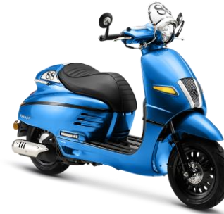
Xanh Lam Q1