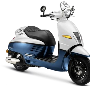
Trắng - Xanh nước biển P7/S5